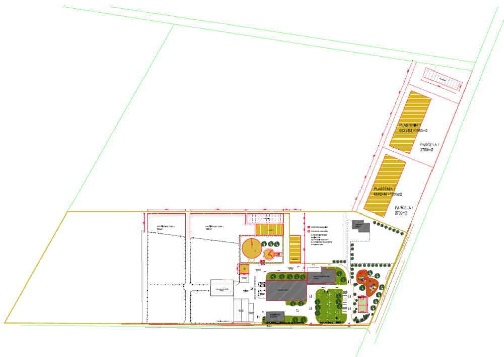
Prikaz 3 Prikaz područja iz projektnog rješenja dugoročnog razvoja kompleksa farmi s pratećim sadržajima, na Polevama, sadržanog u inicijativi za proširenje predmetnog IGPIN

Proširenje GP za farmu predviđa se radi toga što se osim osnovne djelatnosti stočarske proizvodnje u sklopu kompleksa planira i već dijelom i realiziraju sadržaji edukacijskog centra i bioplinske elektrane. Proširenje IGPIN se predviđa uzduž prometnice, čime se sadržaji edukacijskog centra formiraju kao barijera prema naselju izvedenom s druge strane lokalne ceste LC 20026.