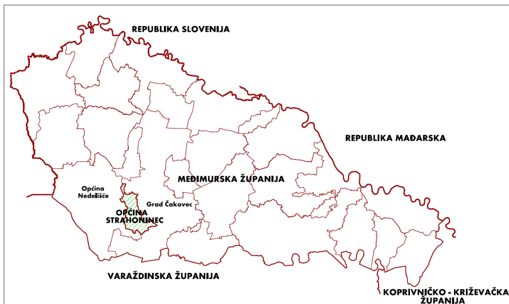
Prikaz 1 Pozicija Općine Strahoninec u Međimurskoj županiji

Općina Strahoninec graniči južno, istočno i sjeverno s Gradom Čakovcem, a zapadno i južno s Općinom Nedelišće.